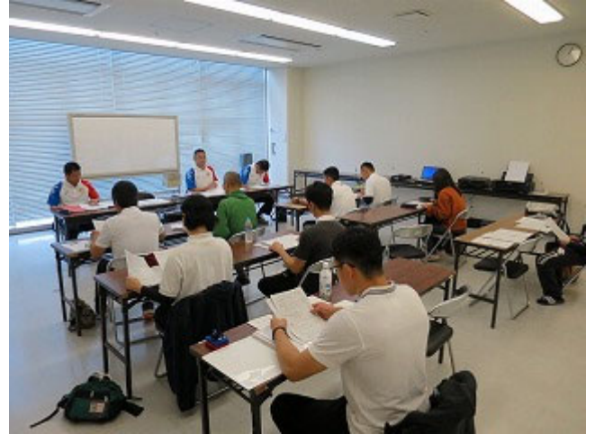
ルール確認他、多くの質問もあり充実した講義でした