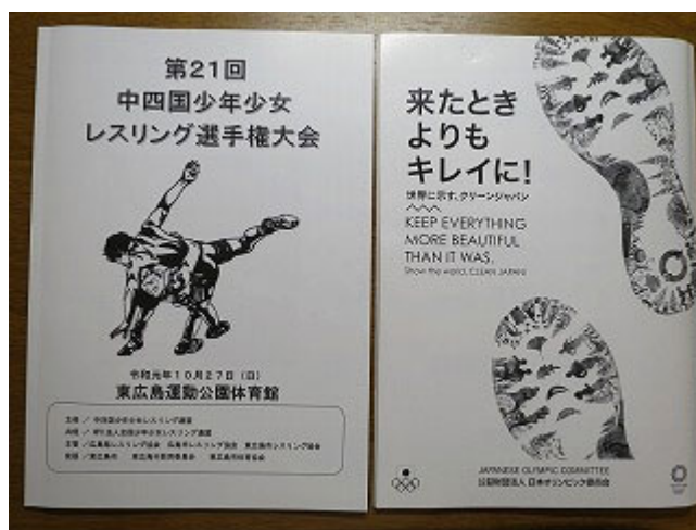
大会パンフレット