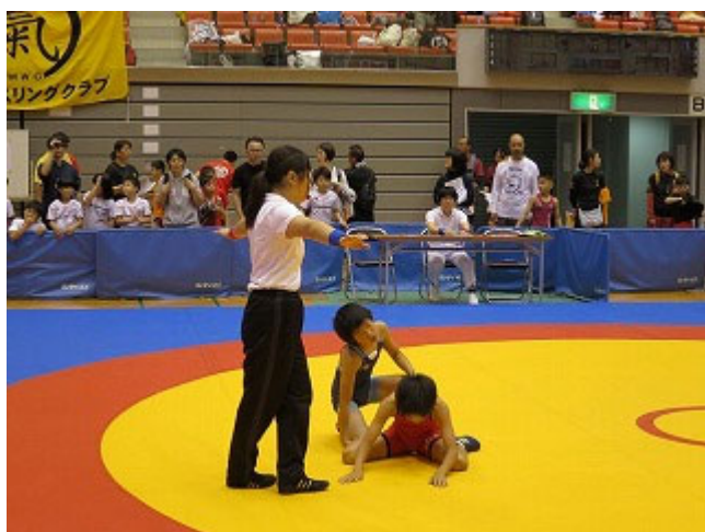
【実技試験】レフリー