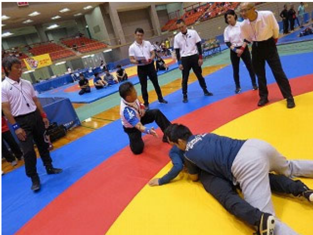
【深水・貞末・瀬野Ct1審判員による実技講習】 具体的な審判法やルール、ポジショニング、得点の定義等を説明しがぶり技や持ち上げなど危険な技術展開や新ルールについては特に細かな説明を行いました