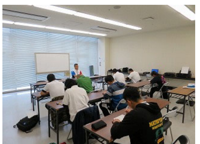
【筆記試験】真剣に取り組まれています