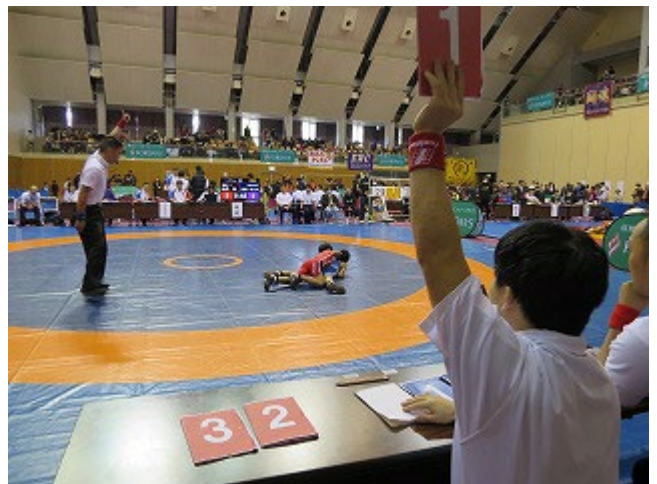
【実技試験】ジャッジ