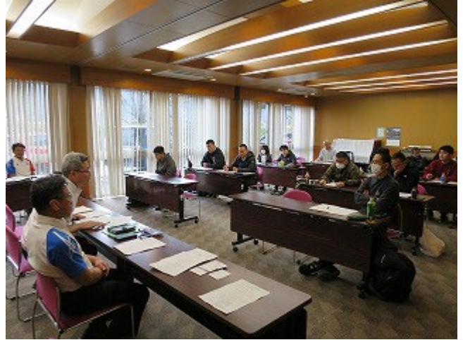
ルール確認他、多くの質問もあり充実した講義だった