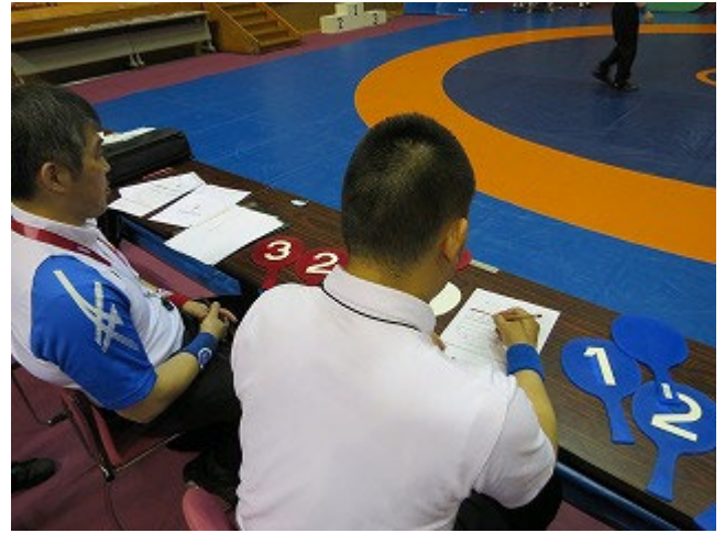
【実技試験】コントローラー