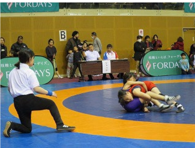
【実技試験】レフリー