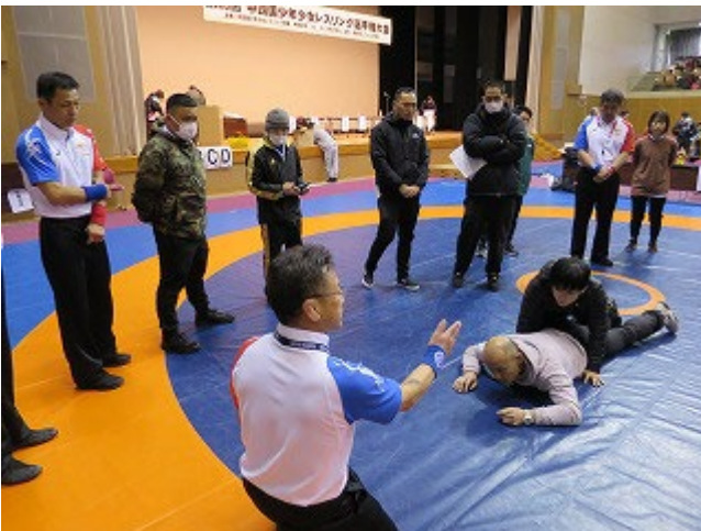
【深水・貞末カテゴリーⅠ審判員による実技講習】 具体的な審判法やルール、ポジショニング、得点の定義等を説明しがぶり技や持ち上げなど危険な技術展開等については特に細かな説明をおこなった