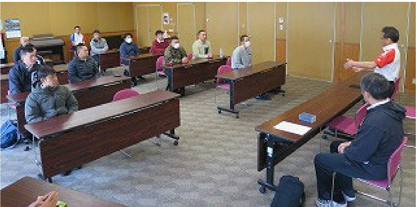
【認定式】試験の講評と審判心構えの確認の後、審判手帳の配付